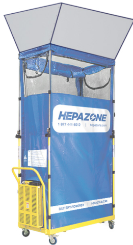
HZTA : Adaptateur de tuiles

Housse de protection pour garder votre HepaZone propre lors de l'entreposage.