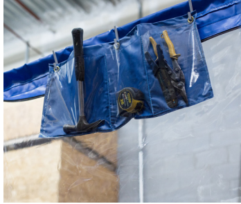
HZ-12 : Sac à outils

Kit d'extension de 4' pour rejoindre les plafonds de plus de 10'.