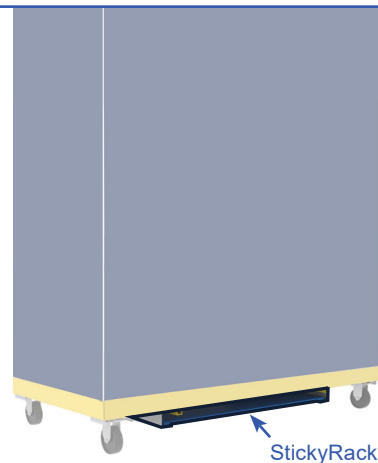
HZ-SR : StickyRack

Adaptateur 60" x 60" pour tuiles de plafond surdimensionnées.