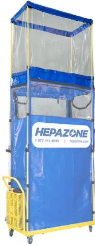
HZ-07 : Kit d'extension de 48"

Kit d'extension de 4' pour rejoindre les plafonds de plus de 10'.