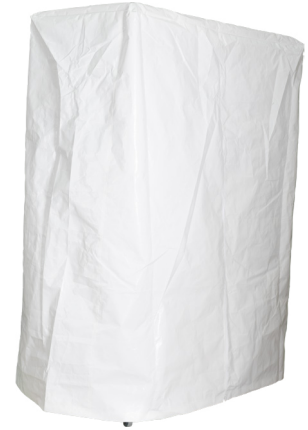
HZ-08 : Housse de protection

Sac à outils avec crochets. S'installe sur le bord du cadre supérieur.